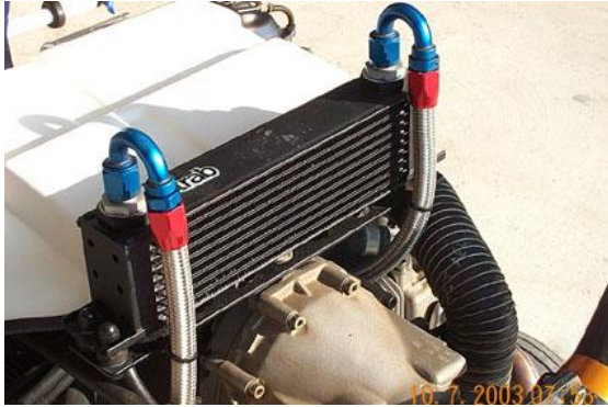
A- Ancien montage