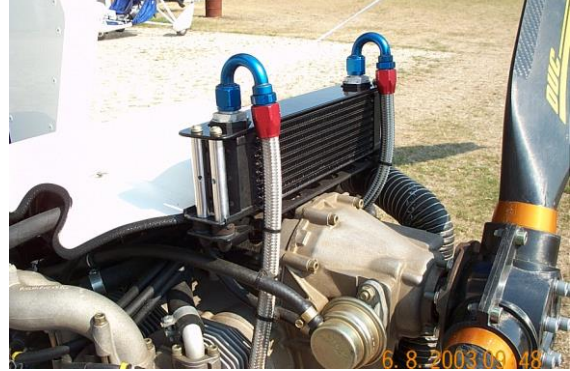
B- Montage avec entretoises taraudées